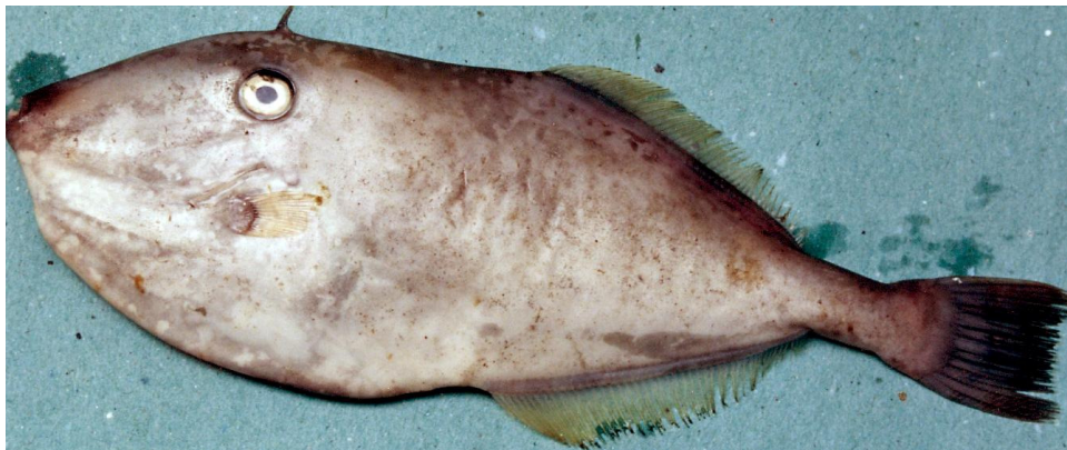
Gambar 2. Ikan ayam-ayaman ( leather jacket, Alesterus monoceros ).

Komunitas ikan mendiami suatu karakteristik ekosistem yang dikontrol oleh kaidah biofisik, di sana hidup berdampingan pemangsa alami ( predator ) dengan mangsa ( prey ). Dengan pandangan sederhana bahwa nelayan sebagai pemangsa baru yang memasuki sistem tersebut, dan dalam konteks perikanan multispecies , nelayan sebetulnya adalah pemangsa jenis lain. Sampai dengan batas tertentu (hasil tangkapan lestari), jumlah ikan yang tertangkap oleh nelayan menggantikan kematian alami. Tetapi di luar batas tersebut, eksploitasi akan menurunkan populasi ikan, pada gilirnya kekosongan niche ekologi dari penurunan 1 spesies kerap kali digantikan sementara oleh spesies lainnya (Laevastu & Favorite, 1988). Pauly (1982) diacu dalam Seijo et al. (1998) mengatakan lebih tangkap ( over fishing ) yang telah diamati adalah kecenderungan menurunnya sebagian besar komunitas ikan tingkat tinggi dari trophic chain . Pauly (1982) diacu dalam Martosubroto (1982) mengatakan bahwa spesies sebagai mangsa ( prey ) akan mengalami penurunan lebih dahulu, selanjutnya diikuti oleh spesies sebagai pemangsa ( predator ).